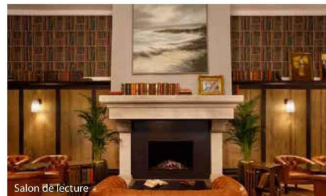
Salon de lecture