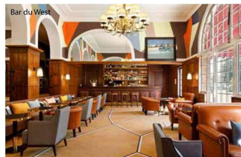
Bar du West